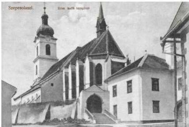
farský kostol sv. Jána Krstiteľa od námestia - pohľadnica spred r. 1913